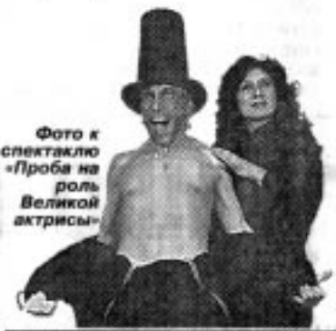
Фото к спектаклю «Проба на роль Великой актрисы»